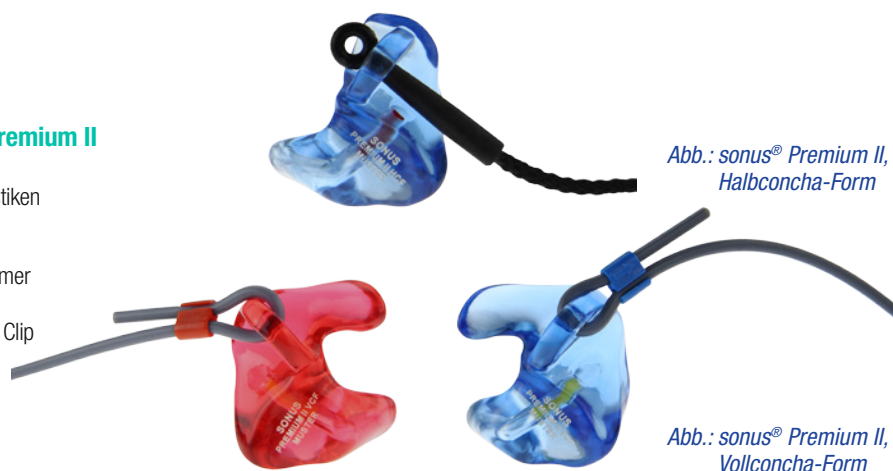
Abb.: sonus® Premium II, Halbconcha-Form