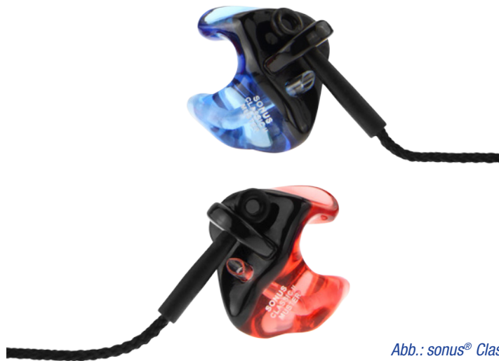
Abb.: sonus® Classic II, Vollconcha-Form